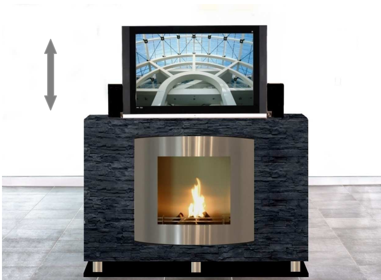
TV-LIFTBOY mit offenem Kamin und Gel-Feuer