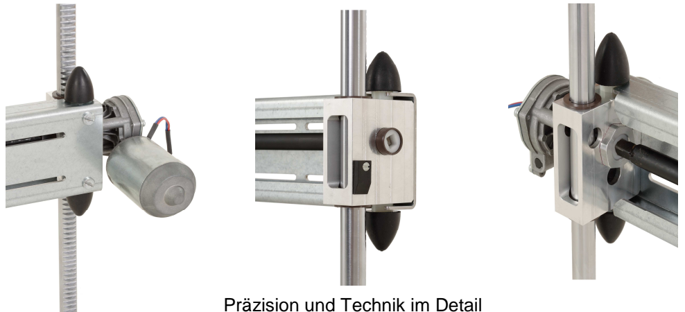
Präzision und Technik im Detail

Der Liftboy ist ein echtes Qualitätsprodukt Made in Germany: Er wurde in Deutschland entwickelt und wird in Deutschland produziert.